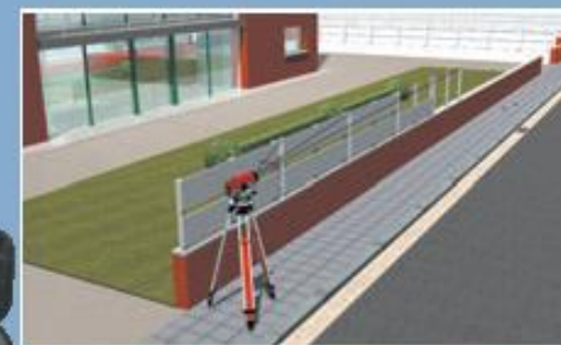
Nivelación de elevaciones con los niveles Pentax serie AP-100